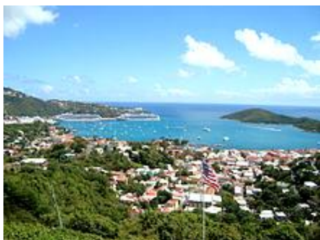
Magens Bay, St. Thomas