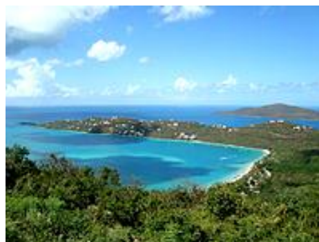
Charlotte Amalie, St. Thomas