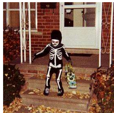
Koledník aneb 'Trick or Treater'

Den díkuvzdání - Thanksgiving Day: Je to další naše tradice, ale pro změnu v Praze. Původně to je tradiční severoamerický svátek, který patří do období dožínků. Historicky se jedná o náboženský svátek, v němž lidé vzdávají díky Bohu, běžně jej však slaví i lidé bez vyznání. Tradiční výklad bývá takový, že Den díkuvzdání poprvé slavili Otcové poutníci spolu se spřátelenými domorodci na podzim roku 1621. Dnes se Den díkuvzdání slaví druhé pondělí v říjnu v Kanadě a čtvrtý čtvrtek v listopadu v USA, a tak rovněž u nás, tj. 24. listopadu 2016.