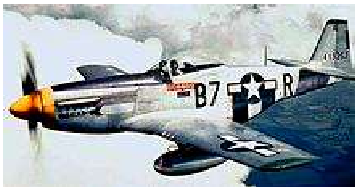
North American P-51 „Mustang“, motor postupně od 1450 do 2200ks rychlost 702 a později 780km/hod., 4 kulometry 12,7mm dolet cca 4650km, létal od roku 1942

Dle informace pamětníků Američané tehdy potřebovali vrtuli pro ukořistěné letadlo Storcha. Fiesler Fi 156 Storch byl spojovací a průzkumný letoun, který vyráběli v Německu od roku 1936 do 1945 v celkovém počtu 3.000ks (za války také v naší Chocni). Rychlost měl od 50 do 175km/hod. a byl vybaven motorem od 180 do 227kW. Startoval během 45m a přistával na 18m. Američané věděli, že poblíž pražské Ruzyně je vhodný sklad. Přijeli s Jeepem a od Rusů si odvezli nejen vrtuli, ale i zraněného pilota Lightingu.