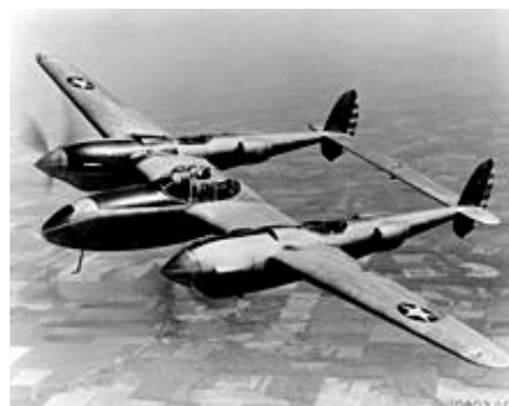
Lockheed P-38 „Lighting“, motory 1150 - 1450ks rychlost 630, později 660km/hod, kanon1x20mm 4 kulometry 12,7mm, dolet 4250km, od r.1941