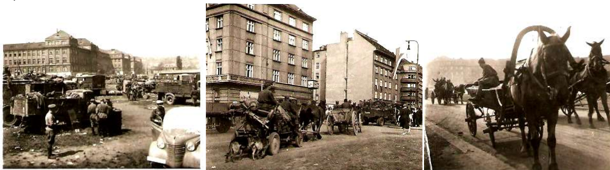
Kulaťák v pražských Dejvicích krátce po obsazení Prahy v květnu roku 1945.

Po ukončení války jsem prohlížel pražské Dejvice. Prolézal jsem i vnitřek německého „Haklu“. Byl to obrněný pásový přepravník pěchoty, který ale měl přední kola jako u nákladáku. Po kotníky jsem se brodil v lehkém popelu. Byly v tom sumky s náboji, přezky apod. Najednou jsem si uvědomil, že ten lehký popel, či saze, jsou vlastně lidské pozůstatky a rychle jsem mizel pryč. Dopoledne mě překvapil houkaný nálet a nad Dejvickou třídou, nad kterou tehdy letěly tmavé dvoumotorové bombardáky s dvojitou zadní směrovkou ve výši, jakou dnes létají helikoptéry a směřovaly na dejvický Kulaťák. Později jsem se dočetl, že po obsazení Prahy ztratilo sovětské velitelství kontakt se svou armádou. Vyslali spojkové jednotky, které se však také odmlčely a tak následovaly skupiny bombardérů. Osádky však na poslední chvíli zjistily, že jejich armáda je v obklíčení vítajícího obyvatelstva.