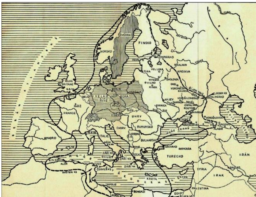
Počáteční německé úspěchy v Evropě (bez kolaborantské Francie)

Z porovnání obou map je zřejmé, že územní úspěchy Japonců byly podstatně větší než spojenců Německa. Nutno však podotknout, že však na mapě vpravo nejsou uvedena území, která ovládala s Němci spojená kolaborantská Francie. Jednalo se nejen o Maroko, Sýrii, Madagaskar, ale i o další je jich kolonie v Africe. Z tohoto důvodu byl velmi důležitý postup Francouzů, kteří pod vedením Ch. de Gaulla úspěšně bojovali na straně spojenců v Africe. To bagatelizovali nejen západní spojenci, ale samozřejmě i komunisté. Možno připomenout, že vojáci Svobodné Francie již v listopadu roku 1940 získali území Francouzské rovníkové Afriky vč. dnešní Středoafriké republiky a Čadu, se kterými má Francie stále vřelé vztahy.