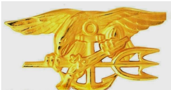
Jeden ze znaků Navy SEALs

Výcvik nových příslušníků je psychicky i fyzicky velmi náročný a je považován za jeden z nejnáročnějších vůbec. Může trvat až 30 měsíců, než člen SEALs dosáhne potřebné fyzické kondice a osvojí si veškeré nezbytné znalosti nutné k jeho nasazení do skutečné bojové mise. Přibližně 75 % zájemců o zařazení k této jednotce proto vzdá výcvik ještě před jeho dokončením.