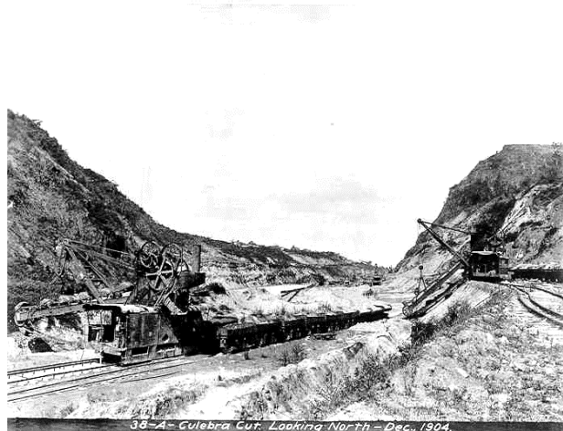
Práce na Culebra Cut v prosinci 1904