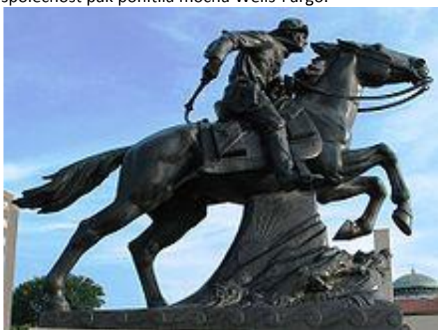
Pomník Pony Expressu v Saint Joseph