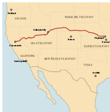
Trasa Pony Expressu v délce asi 3000 km