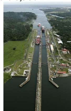
Pohled na jednu z plavebních komor Panamského průplavu

Poslední část smluvní dohody vypršela koncem roku 1999, ale USA si vymínila bránit neutralitu průplavu. Z obrázku vpravo umístěného obrázku je patrné, že lodě jsou v maximálně možné šířce tak, aby se ještě vešly do průplavu.