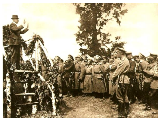
T.G.M. mluví k našemu vojsku v Berezně