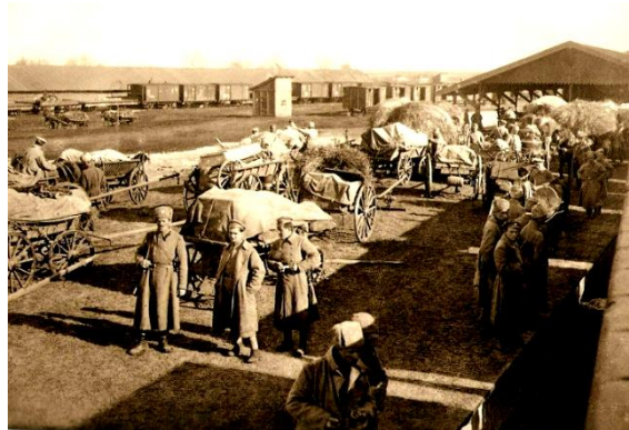
Nakládání na železnici k cestě na východ

Moderní, ale deformovaná výchova: Dle Zdeňka Neubaera se u moderního člověka těžiště poznání, vč. osobnosti a vědomí, přesunulo do levé mozkové hemisféry. Ta vnímá pouze přímočaře. V našem světě pak převládá kauzální a normativní analytické myšlení vč. instrumentální racionality. Nárok na pravdu je tak přiznán pouze takovému vědění, které lze převést na text a vyjádřit kalkulem. V takovém světě se pak uplatňuje zejména abstraktní myšlení.