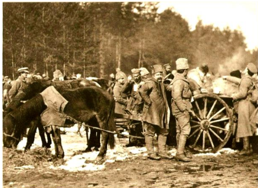
Odpočinek našich legionářů

Naši se však nedali a po obsazení železnice znemožnili návrat německých a maďarských zajatců, kteří by jinak posílili německou západní frontu. Byla to velmi choulostivá doba, ještě před vstupem USA do války. Tak naše vojska podstatně ovlivnila výsledek celé války.