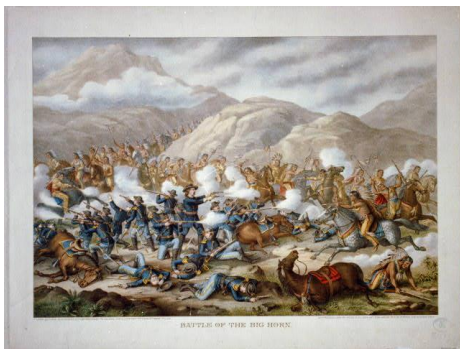
Jedno z mnoha vyobrazení bitvy u Little Big Hornu se střelícím G.A.Custerm současně oběma revolvěry na útočící Indiány.

USA získaly na Mexiku území na západě a brzy tam vyrostla nová města. Postavení železnice však brzdil problém s rezervací, která byla přidělena Indiánům. Trať by je musela objíždět dlouhou oklikou a kromě toho bylo na území Siouxů nalezeno zlato. Indiáni se o tom dozvěděli a schopný šaman Sedící býk sjednotil několik kmenů Siouxů a postavil se na odpor. Washington vyslal několik generálů, aby Indiány porazili. Ti je početně podcenili a místo předpokládaných max. 2000 jich bylo asi 15000. Generál Crook je sice porazil, ale pro velké ztráty se musel vrátit. Generálové Terry a Gibbon marně čekali na Crooka. Pak vyslali na průzkum 7. kavalarii pod vedením podplukovníka Custer, který byl hrdinou občanské války. Dosáhl sice hodnosti generála, ale pro jejich velký počet byl krátce před osudnou bitvou degradován na podplukovníka. Odmítl nabídku Terryho na dalších 300 mužů a před bitvou ještě napadl pokojnou indiánskou slavnost, čímž na sebe velmi upozornil. Z Custrových skupin přežila jen Renova. Siouxům vítězství však moc nepomohlo. Generálové se vrátili s posilami a Siouxy porazili. Custer je oslavován jako hrdina, i když udělal chyby, tj. odmítl nabídnuté posílení jeho skupiny a nevhodně napadl indiánskou osadu.