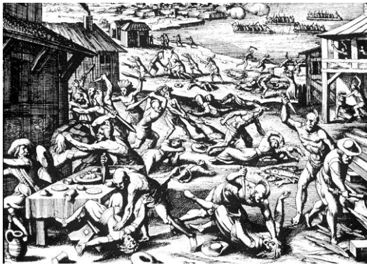
Indiánský útok na osadníky ve Virginii v březnu 1622

Indiánské války: Pokud má někdo hlubší zájem, může si otevřít stánku na internetu pod heslem Wikipedie. Překvapí množství těchto válek. V 17. století se jich uvádí 10, v 18. století 13 a v 19. století 22, tedy celkem 45 válek. První zaznamenané války (počítá se však jako jedna) byly Anglo-powhatanské války v údolí virginské řeky James v letech 1609 až 1614, které byly ukončeny s nerozhodným výsledkem. Poslední byly s kmenem Nez Perce v roce 1877. Spíše v Kanadě pak v roce 1884 boje, zvané Rebélie na Červené řece. Nejznámější jsou však Siouxske války s porážkou 7. kavalérie u Little Bighornu. Boje začaly v roce 1854 a skončily po masakru u Wounded Knee v roce 1890.